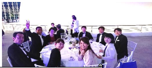
ガラディナーイメージ