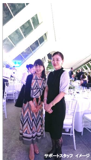
サポートスタッフ イメージ