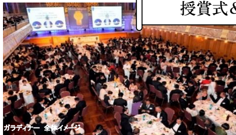
ガラディナー 全体イメージ