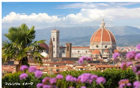
フィレンツェ イメージ

授賞式を終えたあとは、高速鉄道でフィレンツェへ。フィレンツェ到着日午後からはサンタマリアデルフィオーレ教会(大聖堂)、サンタマリアノヴェッラ教会、ベッキオ橋(ポンテベッキオ)をガイドがご案内します。また、イタリアの食事は日本人の口に合うものも多く、ピザ、パスタを始め、ジェラート等のスイーツ食べ歩きもお楽しみの一つです。