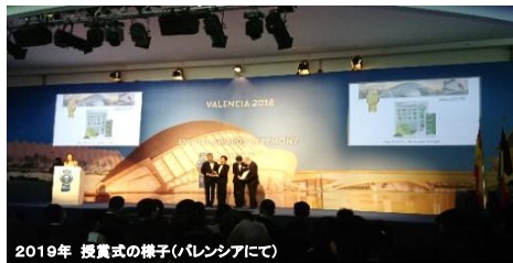
2019年 授賞式の様子(バレンシアにて)

旅の目的である授賞式典・ガラディナーへの参加は経験豊富な弊社スタッフがサポートいたします。授賞式が初めての方も安心してご参加いただけます。服装や持ち物の事など、ご不明な点もお気軽にご相談ください。