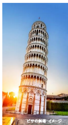
ピサの斜塔 イメージ

フィレンツェのご宿泊先も5つ星ホテルをご用意しております(「世界ホテル案内」の基準による)。19世紀の建物を利用したホテルは美しい庭園を併設しており、庭園を囲む部屋の内装はモダンなスタイルやクラシックなスタイルなど、それぞれ異なります。