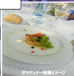
ガラディナー料理イメージ

授賞式前後の出張アレンジや他空港発もご相談ください。柔軟に対応させていただきます。