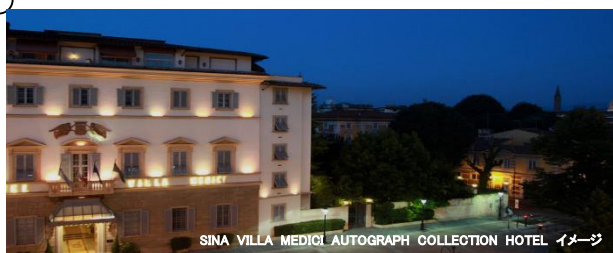
SINA VILLA MEDICI AUTOGRAPH COLLECTION HOTEL イメージ

フィレンツェのご宿泊先も5つ星ホテルをご用意しております(「世界ホテル案内」の基準による)。19世紀の建物を利用したホテルは美しい庭園を併設しており、庭園を囲む部屋の内装はモダンなスタイルやクラシックなスタイルなど、それぞれ異なります。