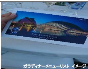
ガラディナーメニューリスト イメージ